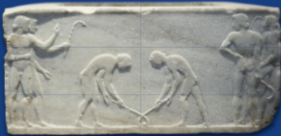
Marmor Relief, ca. 500 v. Chr., Archäologisches Nationalmuseum von Athen

...ein olympischer Mannschaftssport für Männer und Frauen.